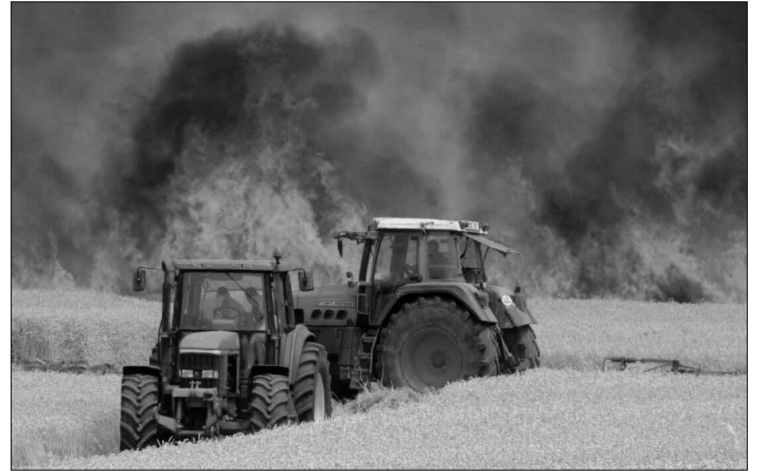
duction agricole nationale, dans un contexte où la sécurité alimentaire demeure un enjeu majeur. » Hamza B.

sécurité à travers différents supports de communication. » Parallèlement, les services de la Protection civile, en coordination avec les autorités locales et les services agricoles, poursuivent « le renforcement des mesures préventives, notamment par l'aménagement de pistes agricoles, la création de bandes coupe-feu et l'installation de points d'eau à proximité des zones de production ». Les agriculteurs sont ainsi appelés « à adopter des comportements responsables afin de réduire les risques de départ et de propagation des incendies. » Un dispositif opérationnel spécifique est également déployé durant toute la campagne de moisson-battage, basé sur le positionnement d'unités d'intervention dotées de moyens humains et matériels adaptés. Ce dispositif vise à garantir une intervention rapide dès les premiers signes d'incendie, limitant ainsi sa propagation et les dégâts potentiels. À travers cette campagne, la Protection civile ambitionne « de renforcer la culture de prévention, de promouvoir la responsabilité collective et de contribuer à la protection durable de la pro-