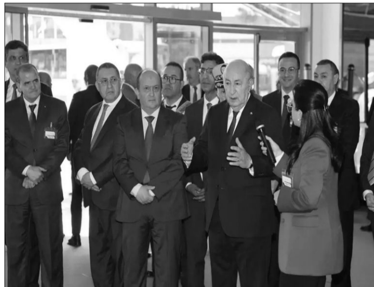
avait entamé sa visite en suivant un exposé exhaustif sur cette 57e édition de la FIA, organisée sous le slogan "Confiance et stabilité pour une croissance durable",

avec la participation d'opérateurs économiques et d'entreprises nationales et étrangères.